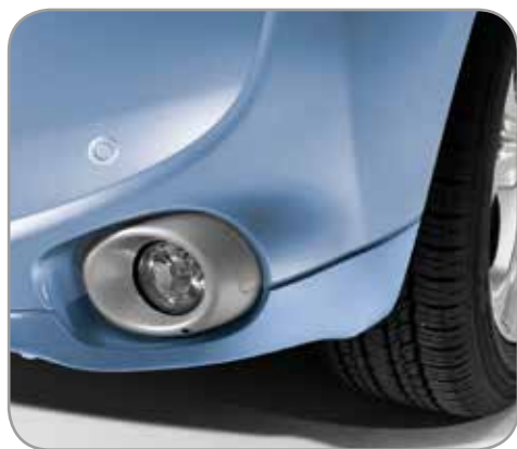
VOORUITRIJDETECTIE/PARKEERHULP set met 2 sensoren in carrosseriekleur