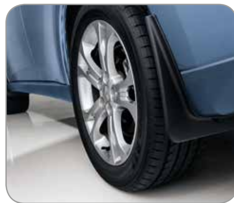
SPATLAPPEN voor- en achterzijde