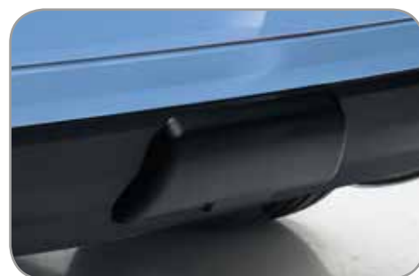
AFDEKPANEEL t.b.v. afneembare trekhaak