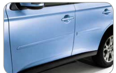
STOOTLIJSTENSET in carrosseriekleur gespoten