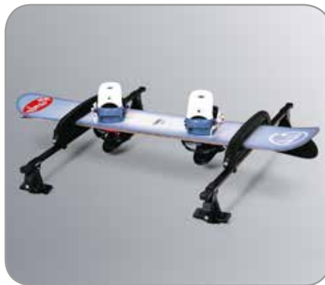
DAKDRAGER TOEBEHOREN diverse mogelijkheden