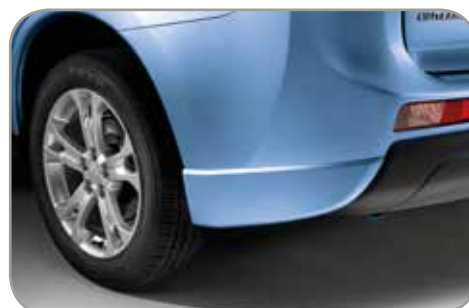
ACHTERBUMPERHOEK VERBREDERSET in carrosseriekleur gespoten