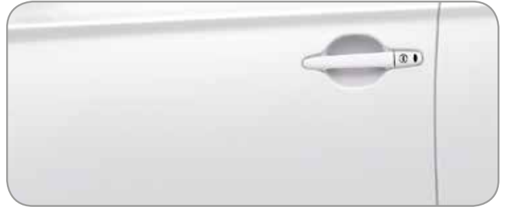
SILKY WHITE [P] (W13)