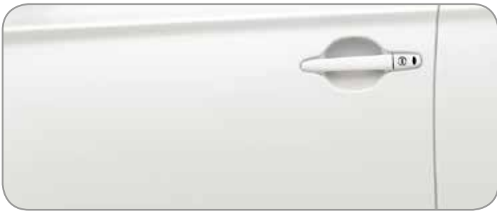
POLAR WHITE [S] (W37)