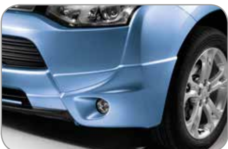
VOORBUMPERHOEK VERBREDERSET in carrosseriekleur gespoten