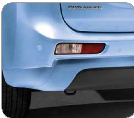
ACHTERUITRIJDETECTIE/PARKEERHULP set met 4 sensoren in carrosseriekleur