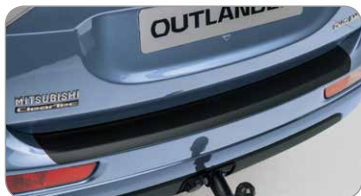
BUMPERBESCHERMFOLIE zwart - transparant