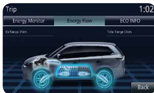
SERIES HYBRID MODE

De generator wordt aangedreven door de verbrandingsmotor, waardoor deze voor voldoende stroom zorgt om de elektromotoren te laten functioneren. Dit gebeurt bijvoorbeeld bij een laag energieniveau in het accupakket of bij krachtig accelereren. In deze modus is er geen directe aandrijving van de voorwielen door de verbrandingsmotor.