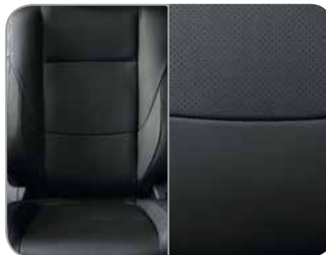
ZWART LEDER (INSTYLE & INSTYLE+)