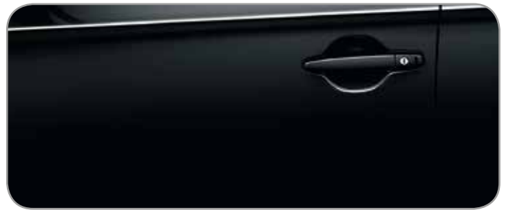
AMETHYST BLACK [P] (X42)