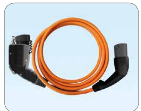
OPLAADKABEL type 2 mode 3 Mennekes kabel