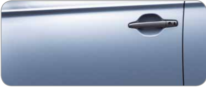
TECHNICAL SILVER [M] (U21)