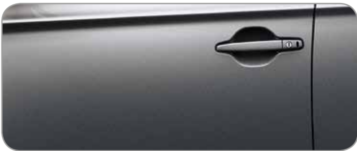
TITANIUM GREY [M] (U17)