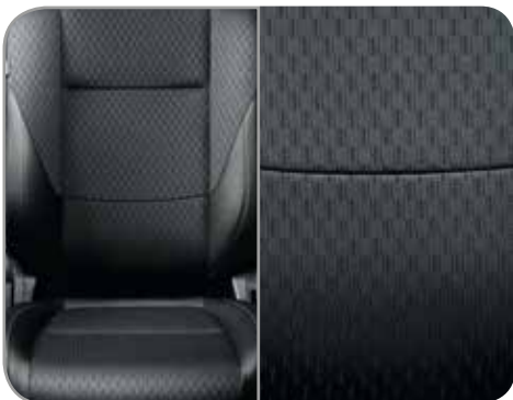
ZWARTE STOF/SYNTHETISCH LEDER (EDITION)