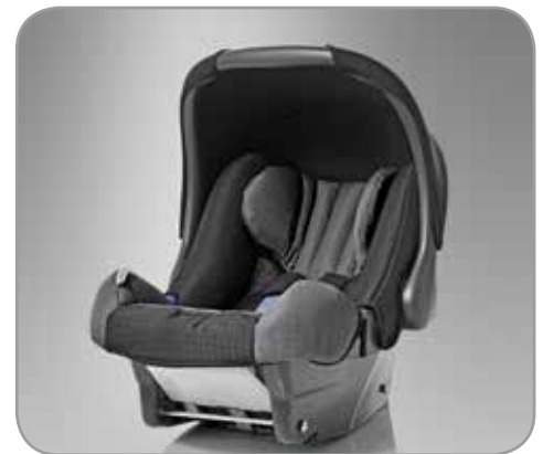
KINDERVEILIGHEIDSZITJES Mitsubishi biedt u kinderveiligheids- zitjes voor alle leeftijdscategorieën