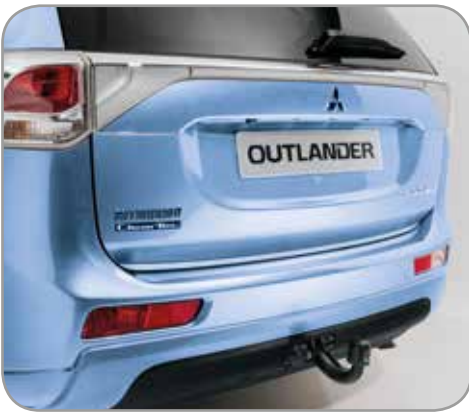
ACHTERKLEPSIERLIJST zilver - chroom