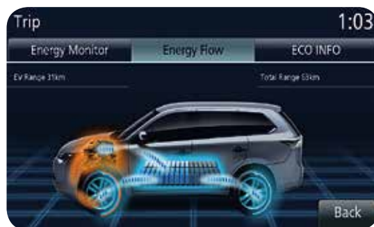
PARALLEL HYBRID MODE

De verbrandingsmotor drijft de voorwielen rechtstreeks aan. De achterste elektromotor levert een gering koppel. In deze modus werken de verbrandingsmotor en de elektromotor parallel aan elkaar. Voor een vloeiende, krachtige acceleratie wordt de elektromotor aan de voorzijde geactiveerd en wordt het koppel op de achteras verhoogd. Bij een constante snelheid werken beide motoren weer zo efficiënt mogelijk samen. Deze modus komt voornamelijk voor tijdens langere ritten op hogere snelheid en kan inschakelen tussen de 55 en 125 km/u afhankelijk van het energieniveau van het accupakket en de gebruiksomstandigheden.