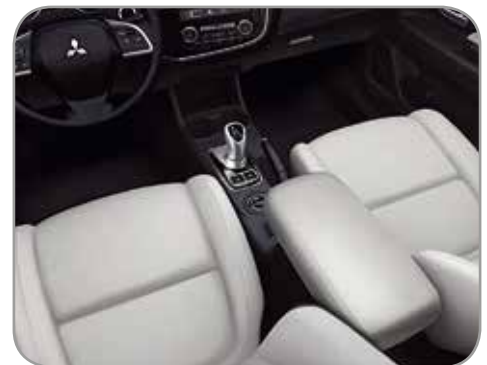
OFF WHITE LEDER (INSTYLE & INSTYLE+)

Standaard zijn de Instyle en Instyle+ modellen uitgerust met zwarte lederen bekleding, maar u kunt zonder meerprijs ook kiezen voor Off White lederen bekleding.