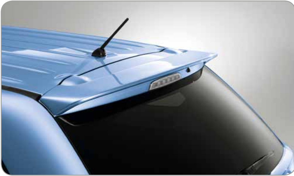
DAKSPOILER in carrosseriekleur gespoten