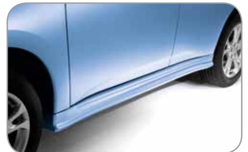
ZIJSKIRTS in carrosseriekleur gespoten